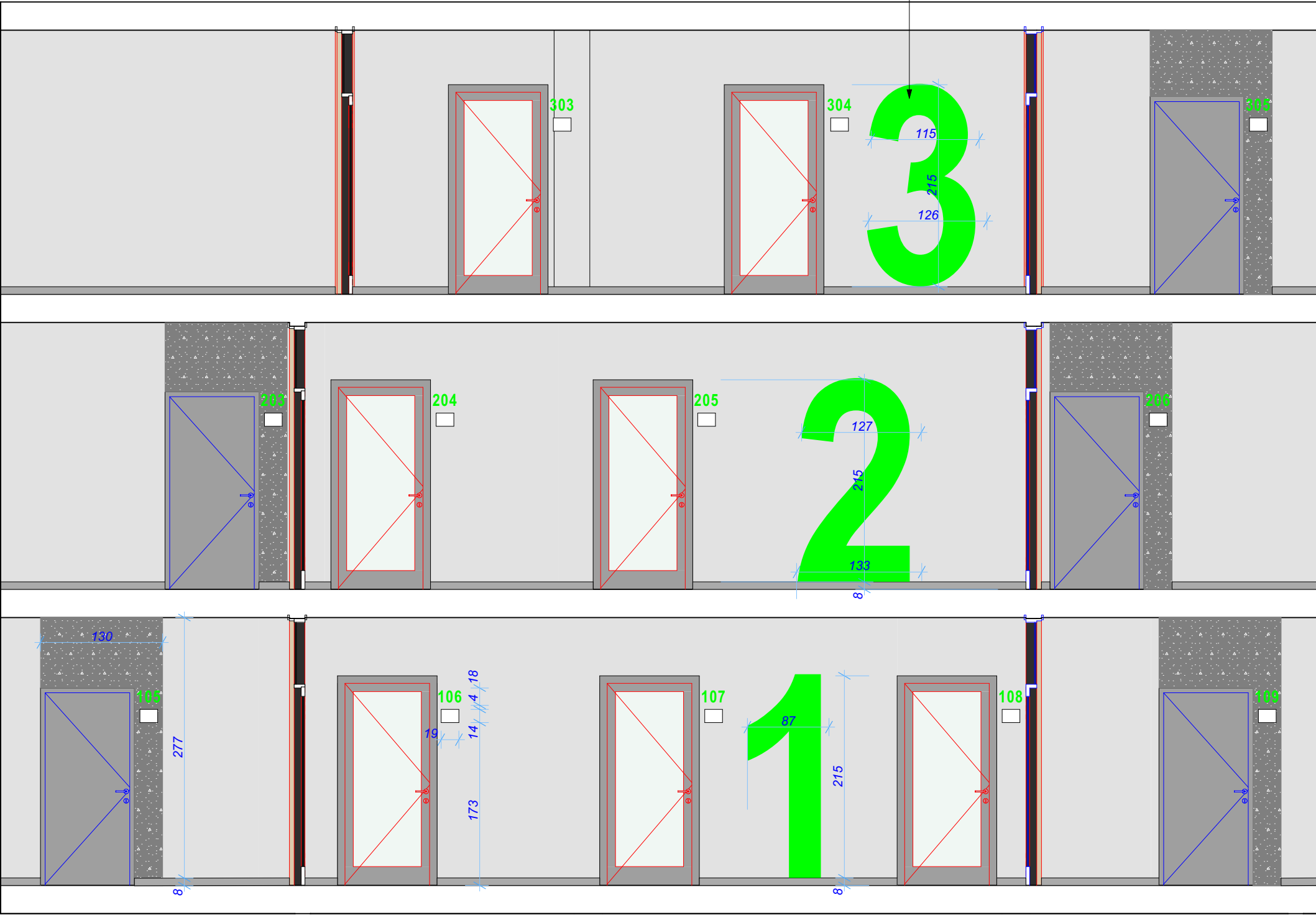
WIDOK 2 : ŚCIANA Z NUMERACJĄ KONDYGNACJI

numeracja kondygnacji wykonana z płyty PMMA (plexi), wyciętej laserowo i oklejonej folią kolor NCS :S 1060-G40-Y